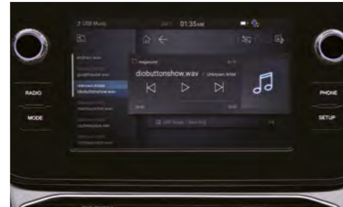
Sistema de infoentretenimiento con pantalla de 20,32 cm (8")