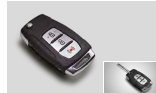
Llave plegable con mando a distancia