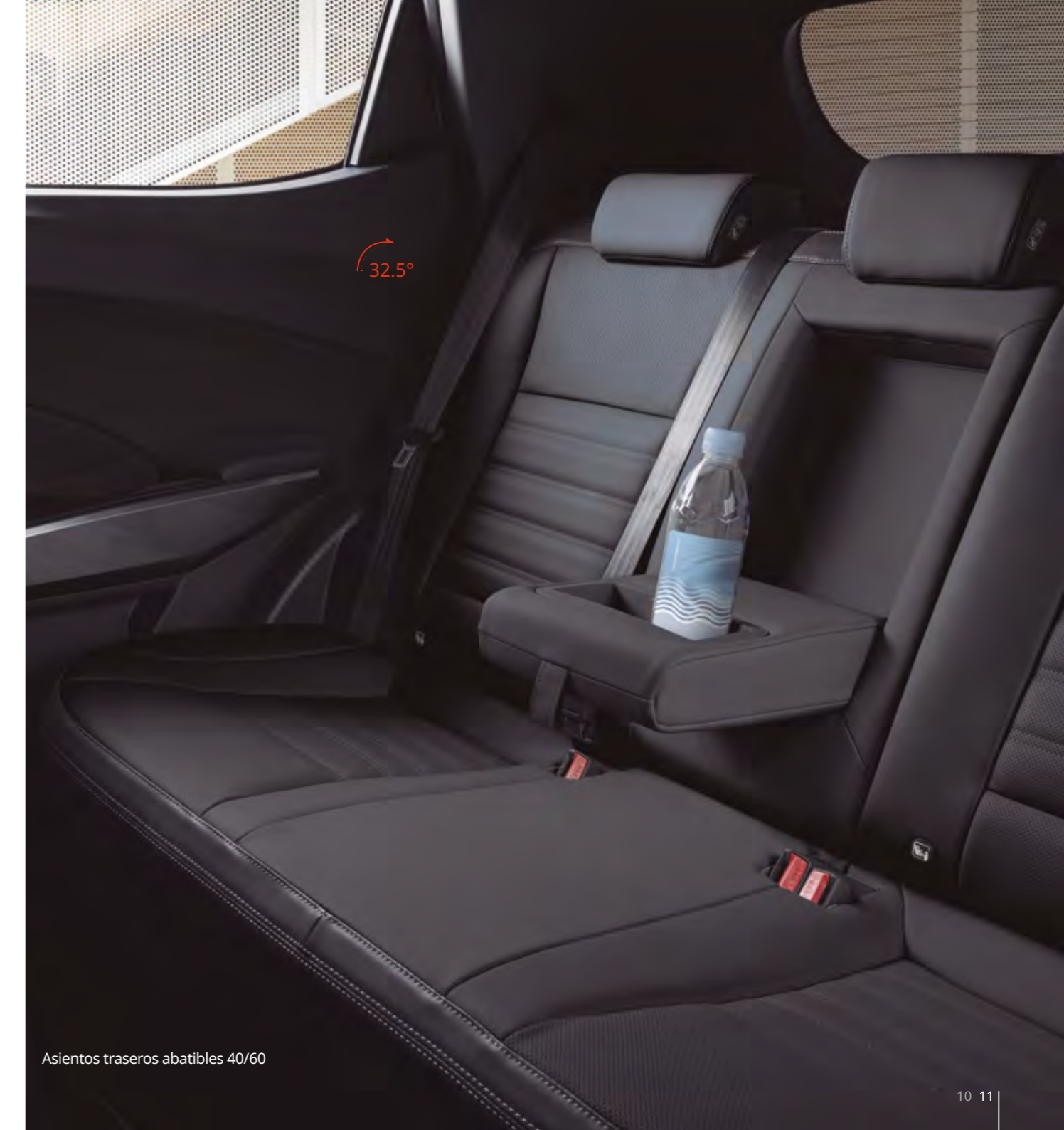
Asientos traseros abatibles 40/60

El resultado es un habitáculo moderno, lujoso y sorprendentemente espacioso, con un nivel de detalles que realza una calidad percibida única en su categoría. El Tívoli ofrece soluciones adaptadas a las necesidades actuales, como un alojamiento específico para tablets, guantera con espacio para un ordenador portátil y porta-botellas en todas sus puertas.