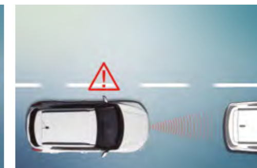
Sistema de alerta de distancia de seguridad (SDA)

Reconoce las señales de tráfico y transmite al conductor la información que aparece en ellas a través del panel de instrumentos.