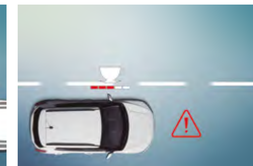
Sistema de advertencia de fatiga (DAA)

El SDA calcula la distancia con el vehículo de delante y avisa al conductor cuando no se mantiene la distancia de seguridad.