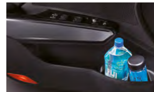
Espacio de almacenaje en las puertas