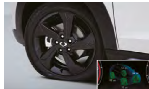
Sistema de control de presión de los neumáticos (TPMS)