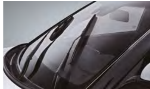
Limpiaparabrisas con encendido automático