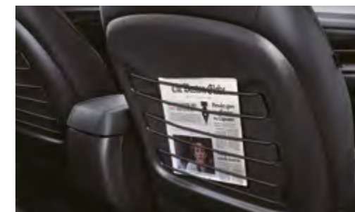
Soporte con cuerda elástica en los respaldos de los asientos delanteros