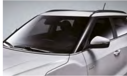
Molduras cromadas en línea de cintura y capó