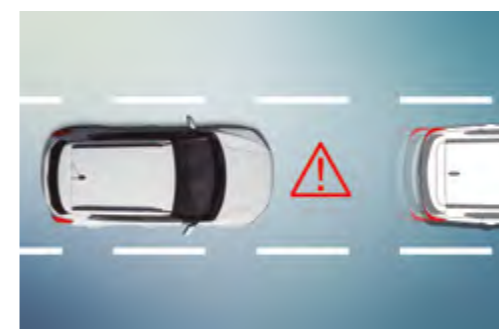
Sistema de aviso de avance del vehículo delantero (FVSA)

Cuando el sistema DAA detecta que el nivel de atención del conductor se ha reducido significativamente, emite una advertencia sonora y muestra una imagen en el panel de instrumentos.