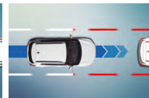
Sistema de permanencia en carril (LKAS) Sistema de advertencia de salida de carril (LDWS)

Cuando el vehículo está detenido y el que está situado justo delante empieza a avanzar, el FVSA emite una alerta visual y otra sonora.