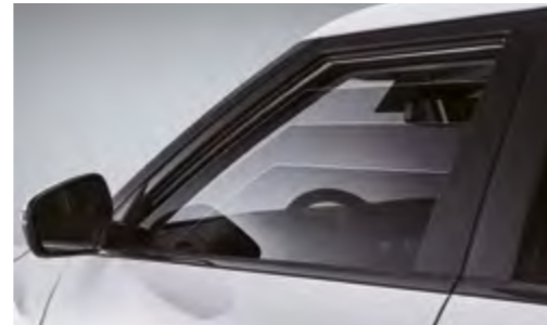
Ventanas eléctricas (delanteras de un solo toque)