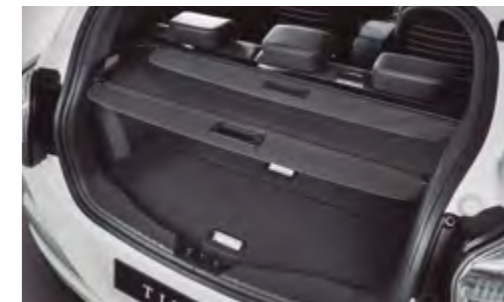
Estor cubre equipajes