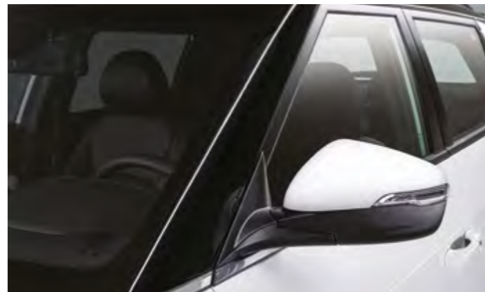
Acabado negro brillante en el pilar A