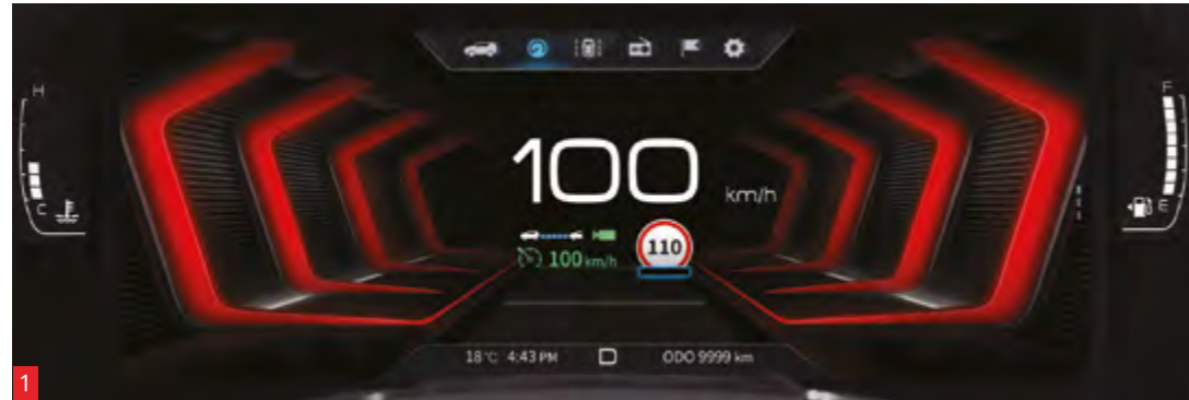
1 Cuadro de instrumentos digital TFT de 26,03 cm (10,2") 2 Sistema de infoentretenimiento con pantalla de 20,32 cm (8") 3 Sistemas Apple CarPlay® / Android Auto™

Sumérgete en el mundo de la tecnología, accede al interior y arranca tu Tívoli sin sacar la llave del bolsillo. Disfruta del Sistema de infoentretenimiento y maneja tu móvil desde la pantalla de 20,32 cm (8") con los sistemas de Apple CarPlay® / Android Auto™, con el sistema de manos libres Bluetooth® o conectándolo al puerto USB.