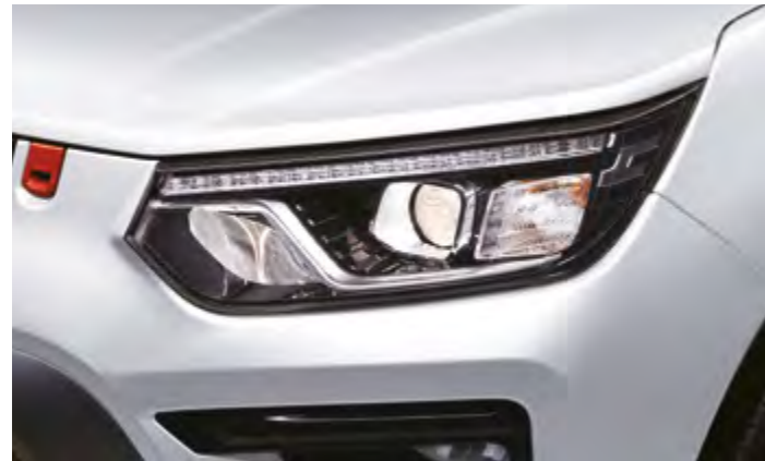
Faros de proyección con luces diurnas LED

PREPÁRATE PARA DISFRUTAR Y HAZLO CON ESTILO