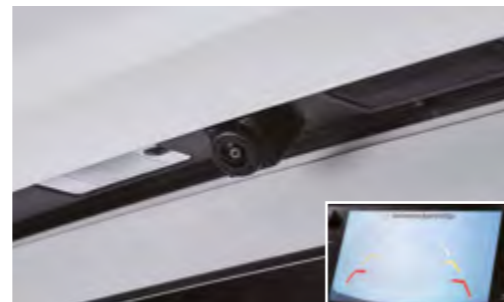
Cámara de visión trasera