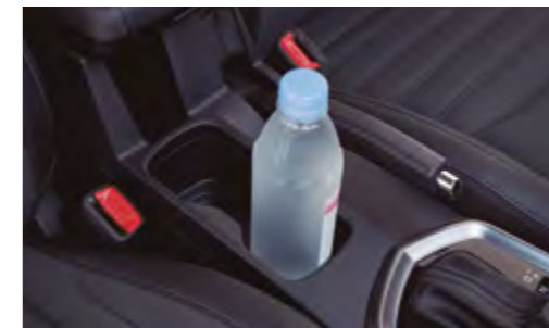
Consola central con dos portavasos