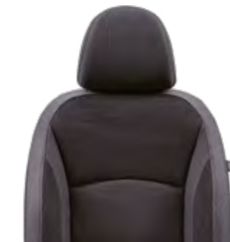
Tapicería de tela negra