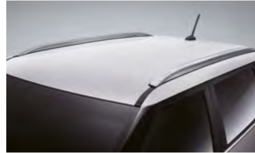
Raíles de techo