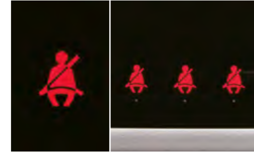
Aviso de cinturones de seguridad en todas las plazas