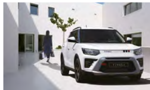
Sistema de acceso y arranque sin llave