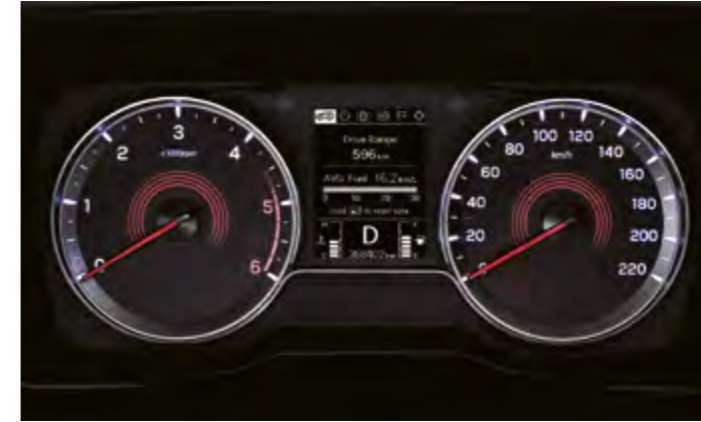
Cuadro de instrumentos con pantalla digital LCD