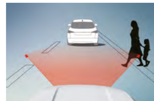
Sistema avanzado de frenada de emergencia (AEBS)

Ayuda a evitar o minimizar el riesgo de colisión detectando vehículos que circulan más despacio o están parados y avisando al conductor con antelación.