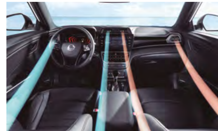
Climatizador automático bizona