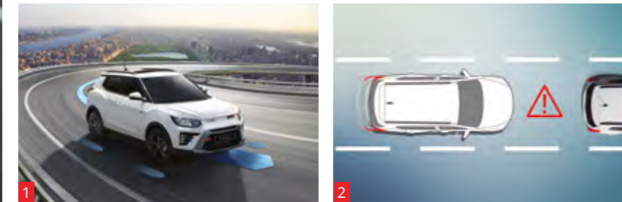
1 Sistema activo antivuelco (ARP) 2 Aviso luminoso de frenada de emergencia (ESS) 3 Control de descenso en pendientes (HDC) 4 Asistente de arranque en pendientes (HSA)