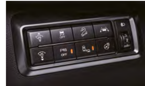
Consola de conmutación múltiple