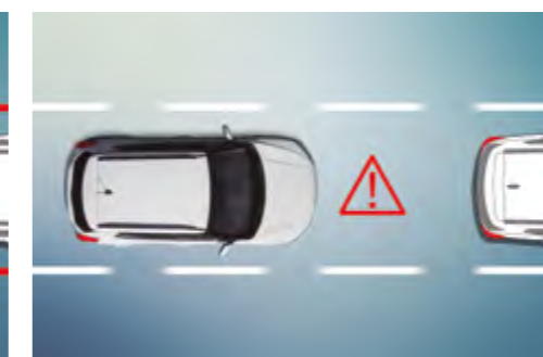
Sistema de alerta de colisión frontal (FCW)

Estos sistemas utilizan una cámara frontal para controlar las líneas de delimitación de carril pintadas. Al detectar un intento de cambio de carril sin señalización previa, el LDWS alerta al conductor y el LKAS corrige automáticamente la dirección para mantener el vehículo dentro del carril.