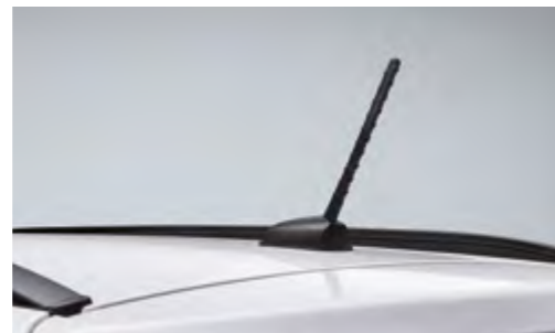
Antena de poste montada en el techo