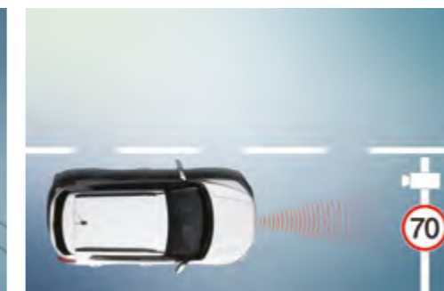
Sistema de reconocimiento de señales de tráfico (TSR)

Ayuda a evitar o minimizar el riesgo de colisión detectando vehículos que circulan más despacio o están parados y avisando al conductor con antelación.