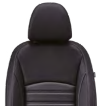
Tapicería mixta (tela y símil cuero)